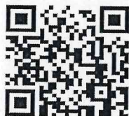
ช่องทางการรับสมัคร